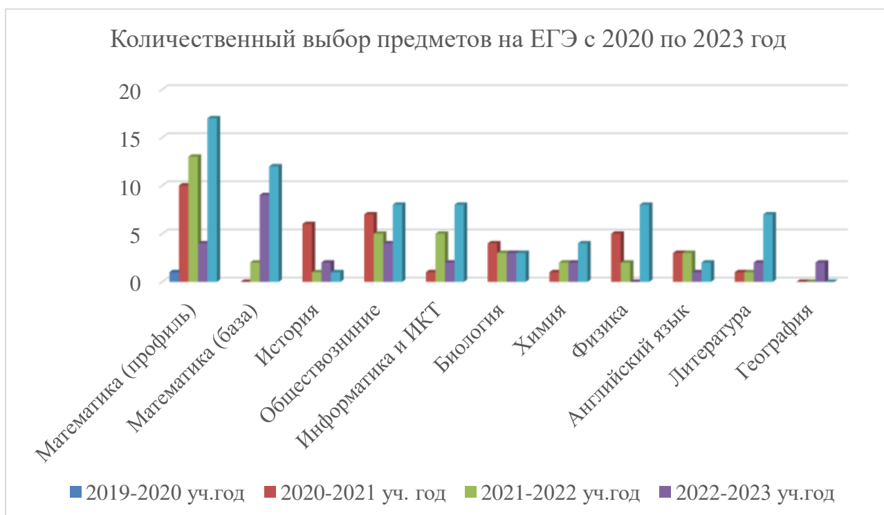
Рисунок 14 – Количественный выбор предметов на ЕГЭ с 2019 по 2022 год

В 2022-2023 учебном году учащиеся 11 класса набрали повышенные баллы: